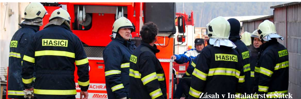
Zásah v Instalátérství Šátek

ČLENOVÉ SBORU DOBROVOLNÝCH HASIČŮ KOSTELNÍ LHOTY