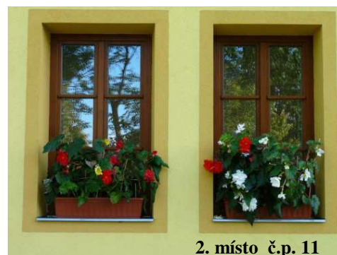
2. místo č.p. 11