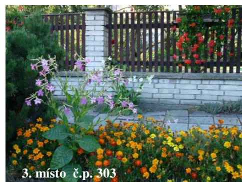
3. místo č.p. 303