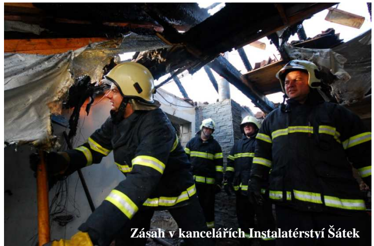
Zásah v kancelářích Instalátérství Šátek

Další tradiční činností byla spoluúčast na akcích pořádaných obcí. Např. Pálení čarodějnic nebo Položení věnců k pomníku padlých.