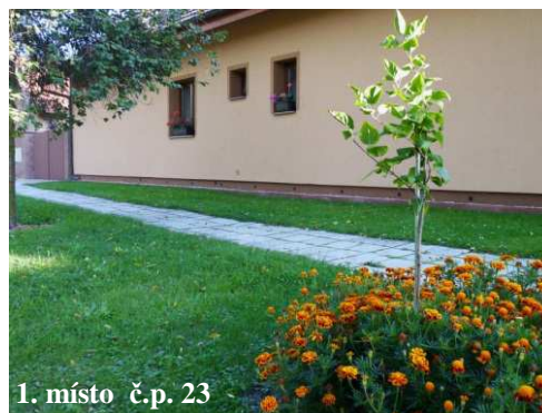
1. místo č.p. 23