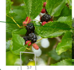
morušovník/jedlý kaštan/jírovec plet'ový/javor.....