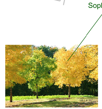
Sophora japonica (jerlín japonský)