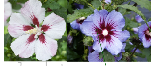
(ibišek - na kmínku)