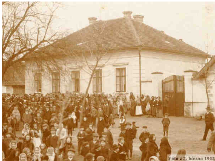
Fara z 2. března 1912