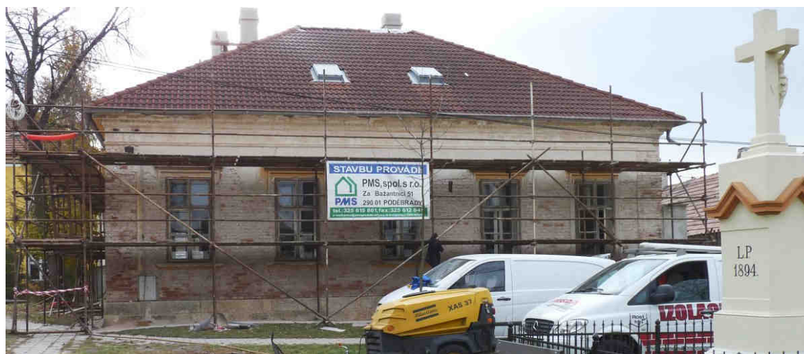
Stavební práce z 3. listopadu 2010

Žádost o dotaci na opravu budovy byla na rok 2009 nejprve zamítnuta, pak ale žádosti o přidělení prostředků z dotačního programu Středočeského kraje bylo vyhověno pro rok 2010. Dotace mohla být poskytnuta za podmínky výběrového řízení dodavatele stavebních prací. Letos na podzim výběrové řízení proběhlo a obci byla potvrzena dotace ve výši 3,7 mil. Kč, což tvoří 95 % celkových nákladů stavby. Ty tedy činí 3,945 mil. Kč. Práce provádí od října 2010 firma PMS Poděbrady. Dokončení díla je plánováno na duben 2011.